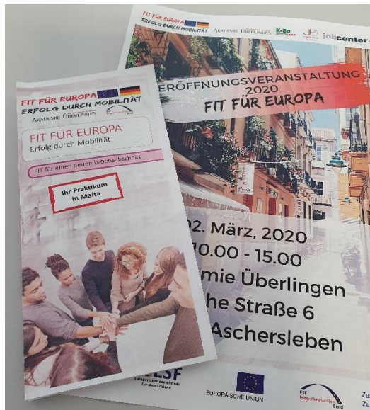
Foto 1: Aktuelle Informationsbroschüre und Einladung zur Eröffnungsveranstaltung „Fit für Europa“.